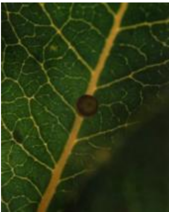
Uovo di Charaxe deposto sulla foglia di corbezzolo